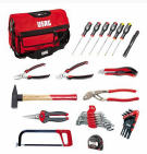
007 A - Professional tool bag with assortment (32 pcs.)